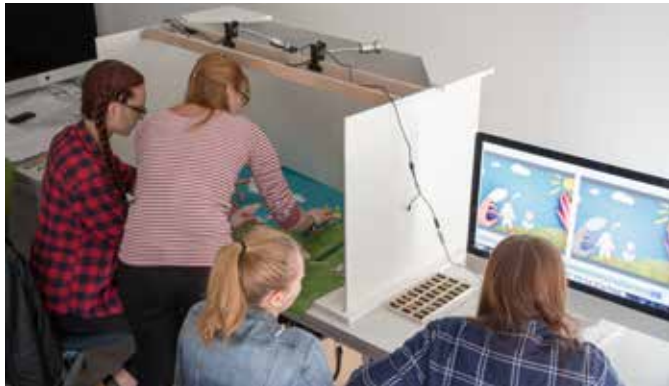
Vom Modell zum Film