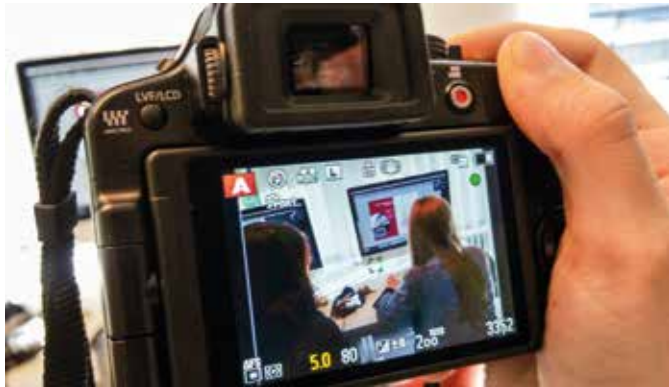
Von der Fotografie zum fertigen Objekt