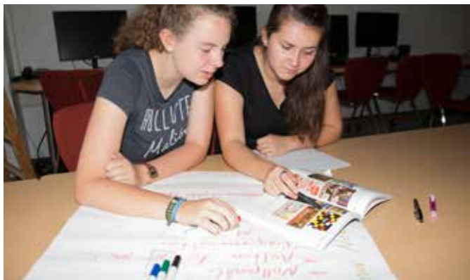
Von der Idee zum Druck